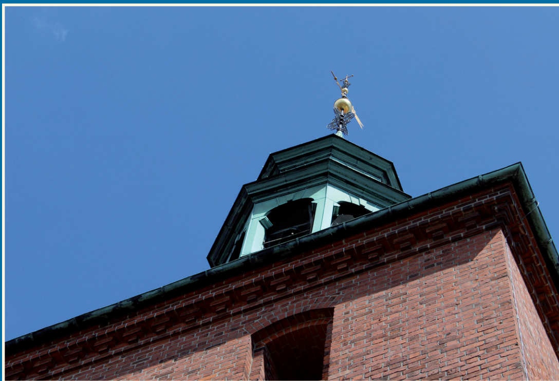
Vor Frue Kirkes klokketårn

Svendborg · April – Maj – Juni – Juli · 2023