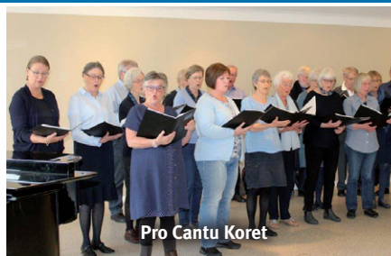
Pro Cantu Koret