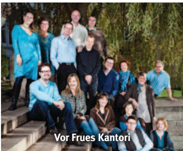
Vor Frues Kantori