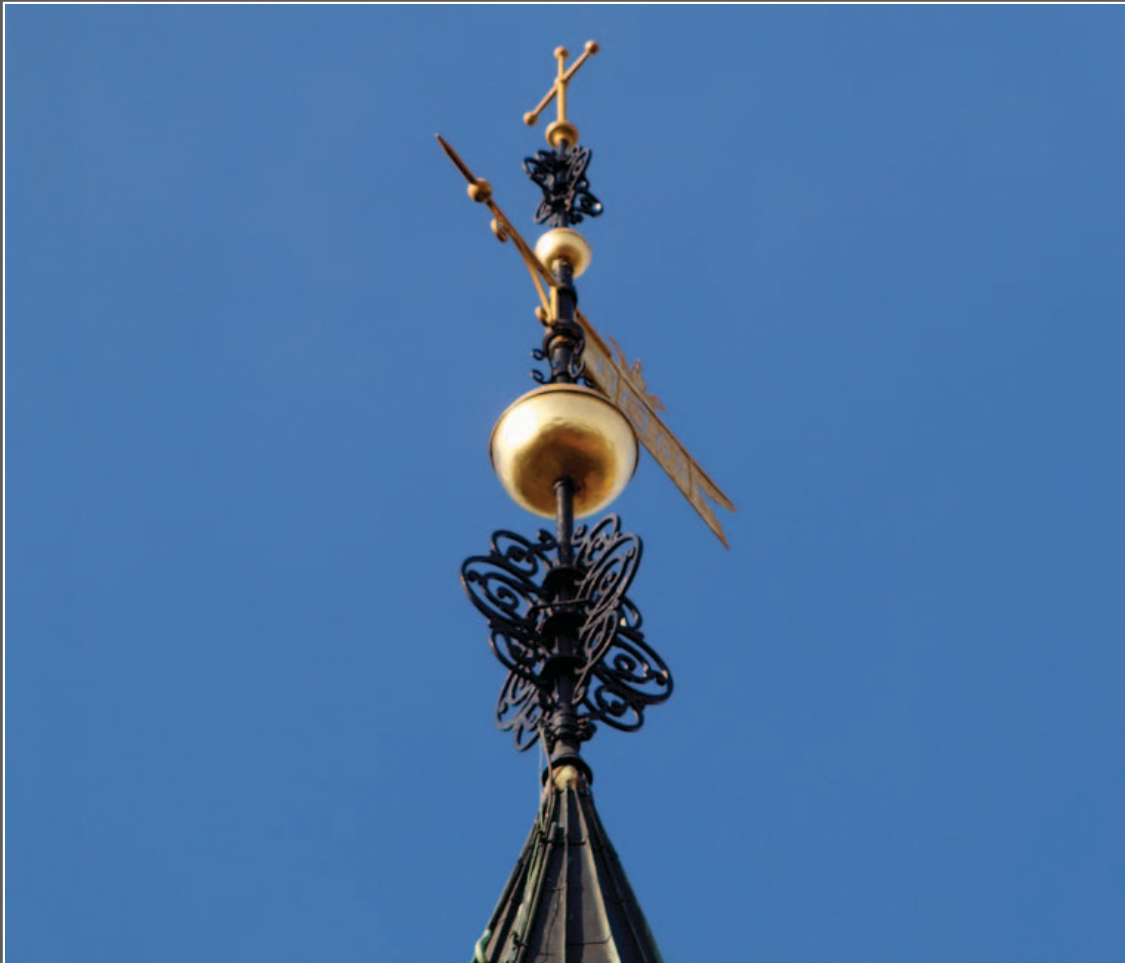
Vindfløj på tårnet af Vor Frue kirke

Svendborg · April – Maj – Juni – Juli · 2014