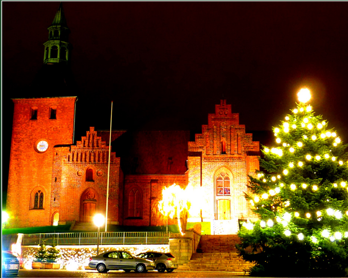
Vor Frue kirke i julebelysning

Svendborg · December – Januar – Februar – Marts · 2017-2018