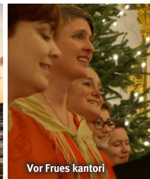
Vor Frues kantori