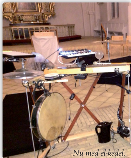
Nu med el-kedel.

Det er en absolut beslutning, dette skal ikke handle ret meget om Luther, det gør – næsten – alt i år, hvis jeg tager et blik på de mange mails, som jeg modtager til kirken med foredragsforslag, teater, koncerter osv. Jeg vil igen henvise til at følge med på provstiets og stiftets hjemmeside, der er alt muligt i fejringens tegn.