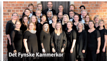
Det Fynske Kammerkor