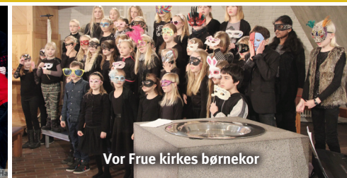
Vor Frue kirkes børnekor