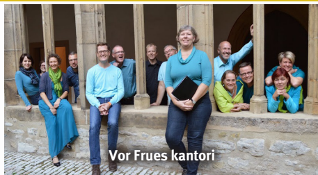
Vor Frues kantori