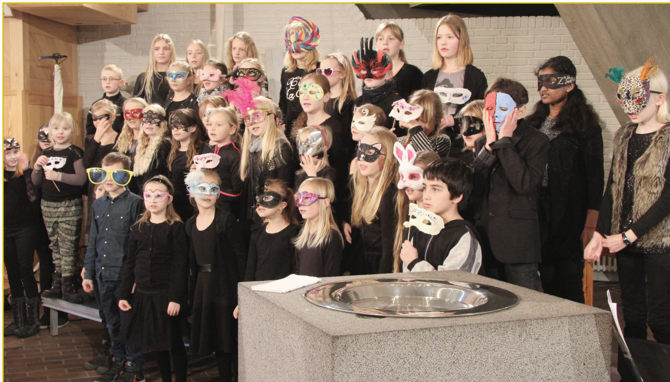
Fra børnekorets medvirken ved fastelavngudstjenesten i tv.