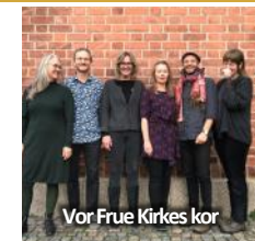
Vor Frue Kirkes kor