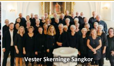
Vester Skerninge Sangkor