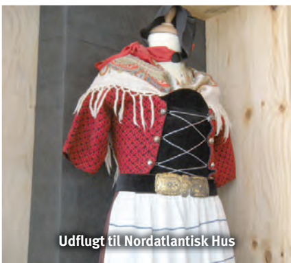
Udflugt til Nordatlantisk Hus