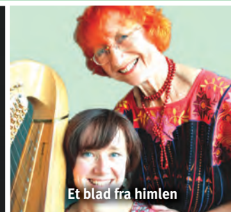
Et blad fra himlen