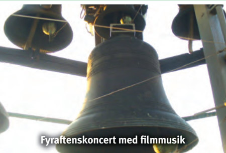
Fyraftenskoncert med filmmusik