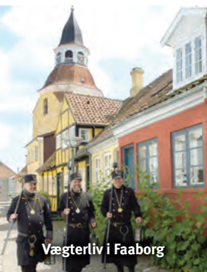
Vægterliv i Faaborg