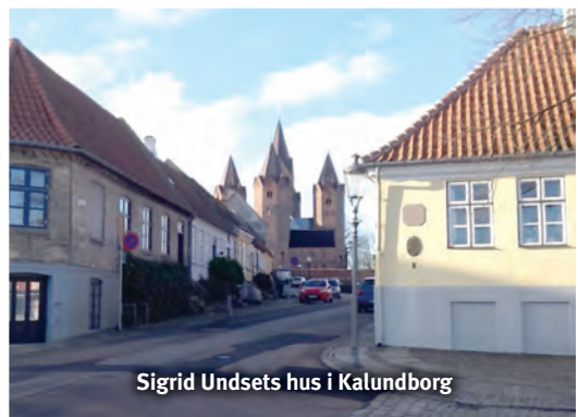
Sigrid Undsets hus i Kalundborg