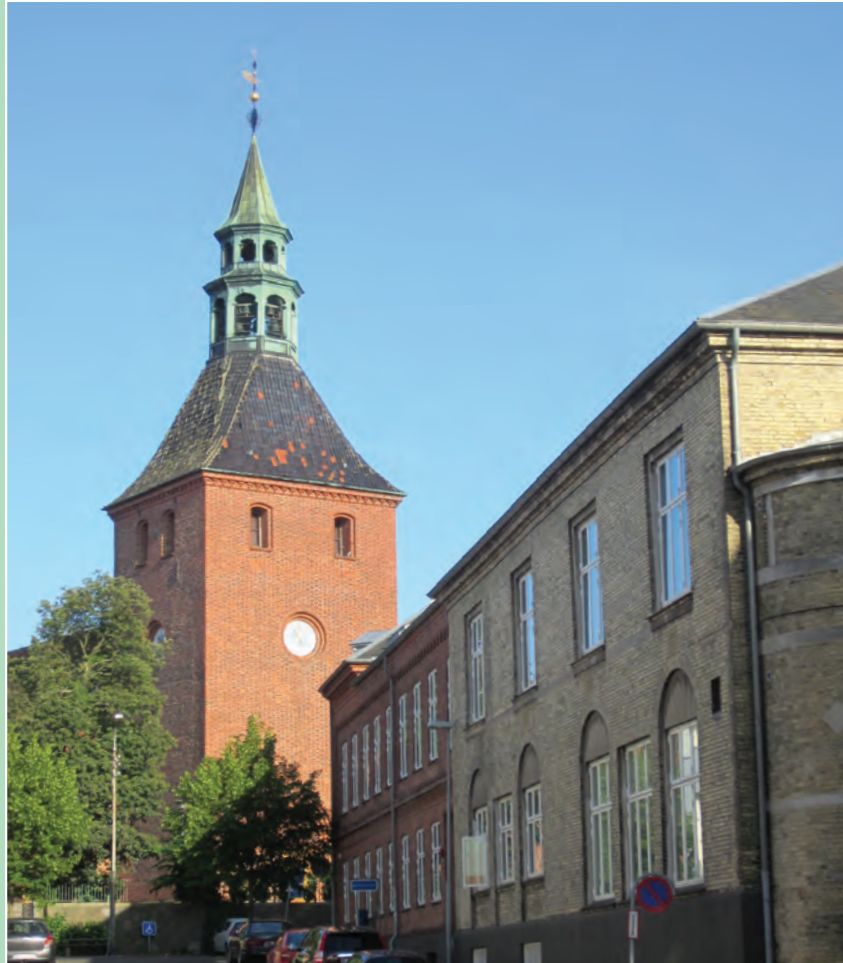
Vor Frue kirke i aftensol

Svendborg · August – September – Oktober – November · 2014