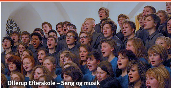
Ollerup Efterskole – Sang og musik