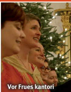
Vor Frues kantori