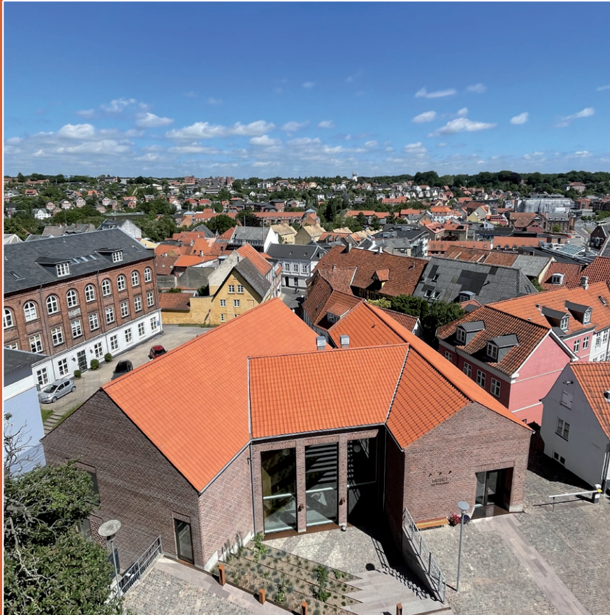
HUSET set fra Vor Frue Kirkes tårn

Svendborg · August – September – Oktober – November · 2022