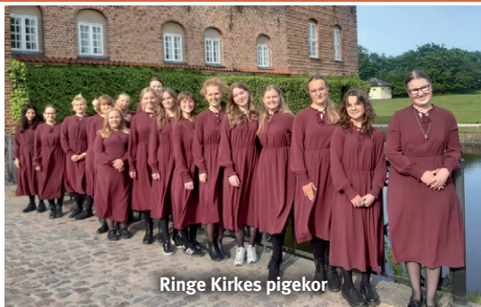
Ringe Kirkes pigeekor