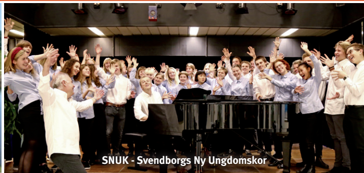
SNUK - Svendborgs Ny Ungdomskor