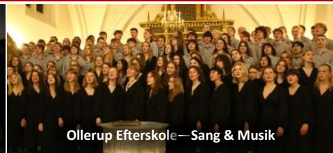
Ollerup Efterskole—Sang & Musik