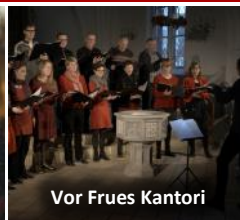
Vor Frues Kantori