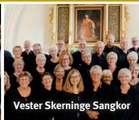
Vester Skerninge Sangkor