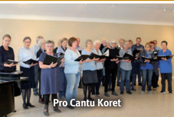
Pro Cantu Koret