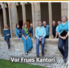
Vor Frues Kantori