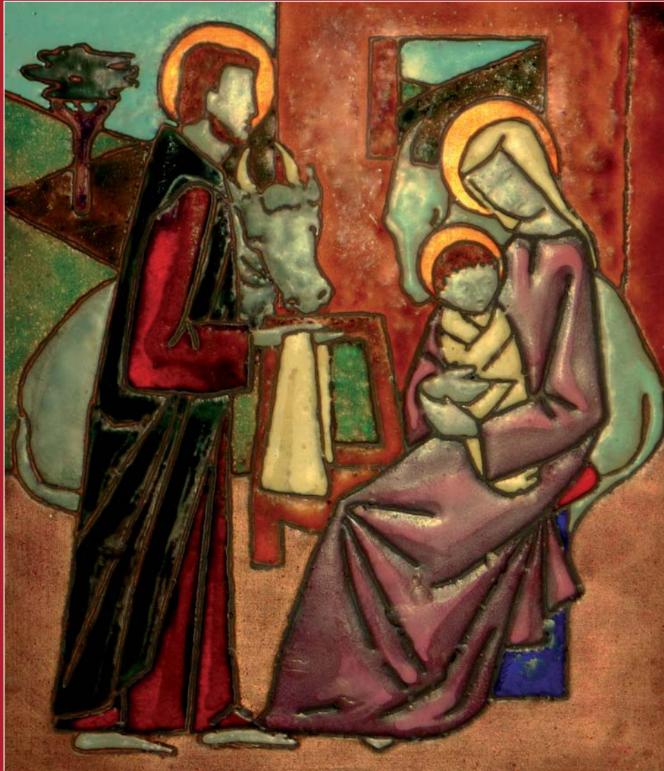
Jesu fødsel Fra altertavle i kirkesalen ved Cittadella i Assisi

Svendborg · December – Januar – Februar – Marts · 2011-2012