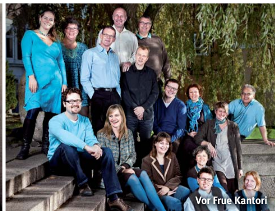
Vor Frue Kantori