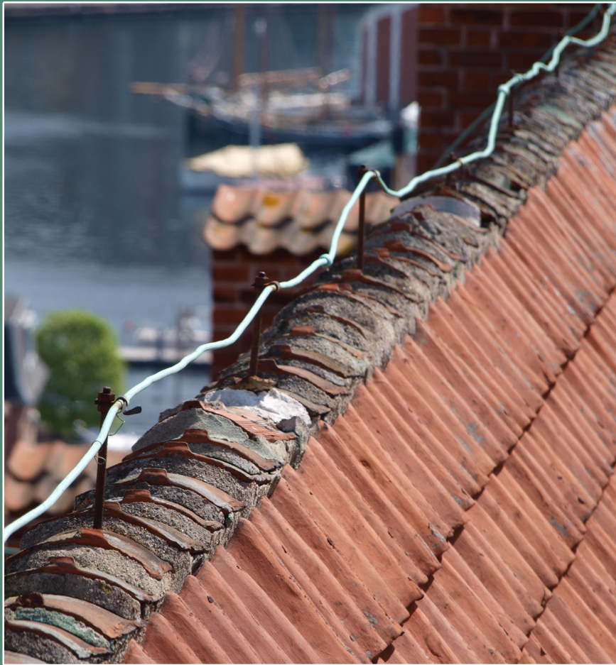
Lynafleder på taget af Vor Frue Kirke

Svendborg · April – Maj – Juni – Juli · 2022