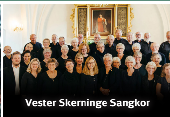
Vester Skerninge Sangkor