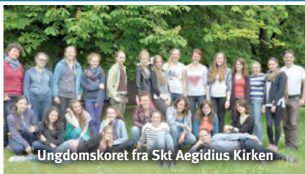
Ungdomskoret fra Skt Aegidius Kirken