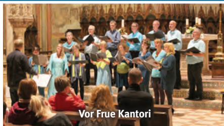
Vor Frue Kantori