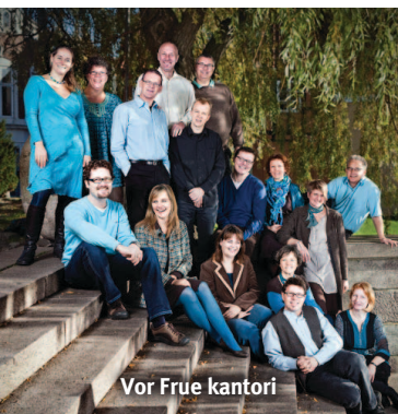
Vor Frue kantori