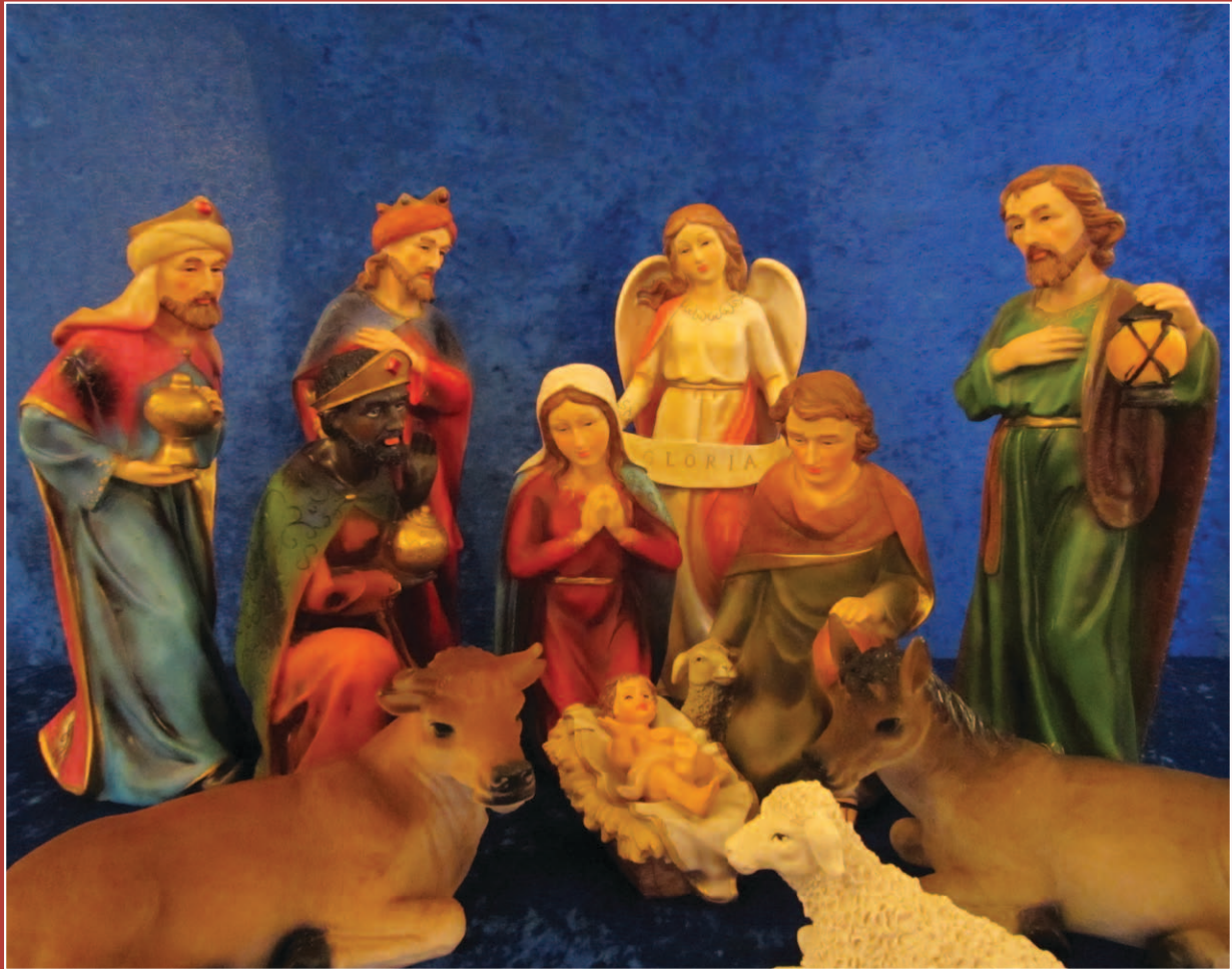
Julekrybbe i Vor Frue kirke

Svendborg · December – Januar – Februar – Marts · 2014-2015