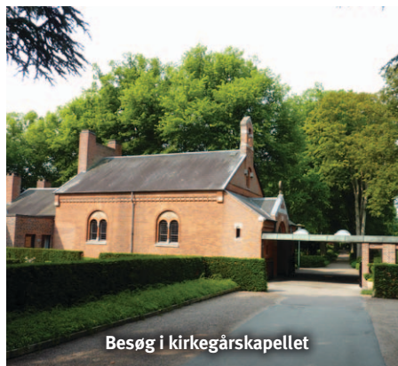
Besøg i kirkegårskapellet