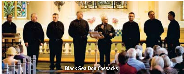
Black Sea Don Cossacks