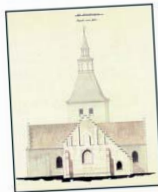
KIRKERNE I SVENDBORG VOR FRUE KIRKE

DANMARKS KIRKER - UDGIVET AF NATIONALMUSEET - SVENDBORG AMT