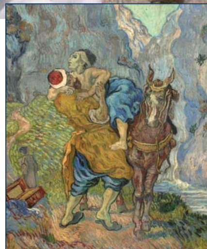
Van Gogh: "Den Barmhjertige samaritaner"

Det er over hundrede år siden, at Folkekirken har stået for et egentligt socialt arbejde. Heldigvis har kirken til alle tider haft ildsjæle, som på frivillig basis eller gennem kristne organisationer stadig gør en væsentlig forskel. Folkekirken Nødhjælp står parat med international katastrofehjælp og langsigtede genopbygningsprogrammer. På gadeplan har vi her i Svendborg bl.a. Frelsens Hær på Lundevej og Kirkens Korshær i Ørkildsgade. Mad og tøj, varme og medmenneskelighed er den opgave, der her løses dagligt på fællesskabets vegne.