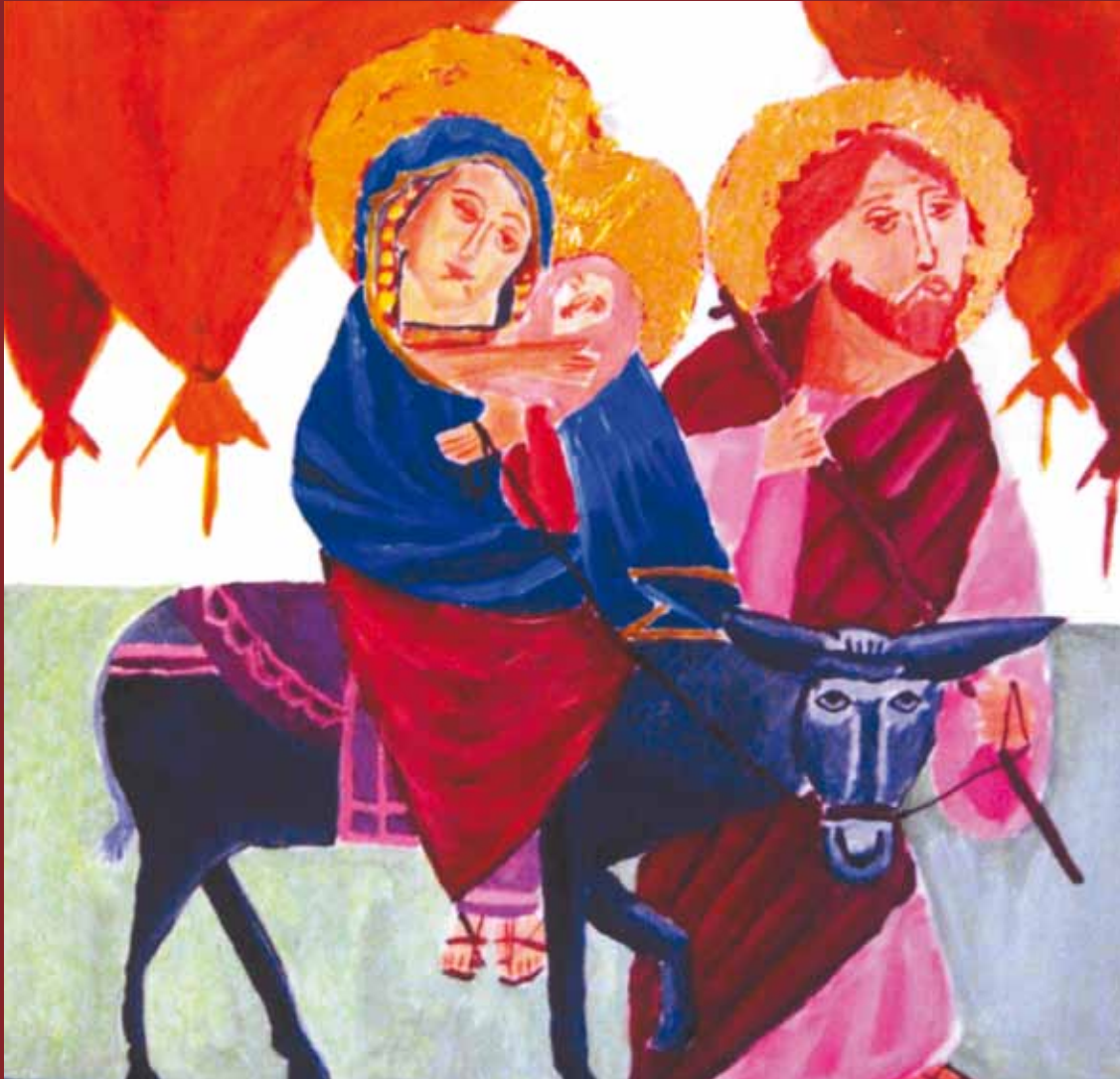
Anne Hune: Flugten til Ægypten

Svendborg · nr. 3 · December – Januar – Februar – Marts · 2010-2011