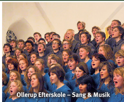
Ollerup Efterskole – Sang & Musik