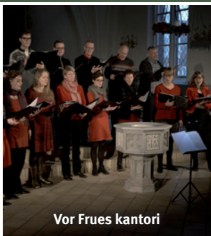
Vor Frues kantori