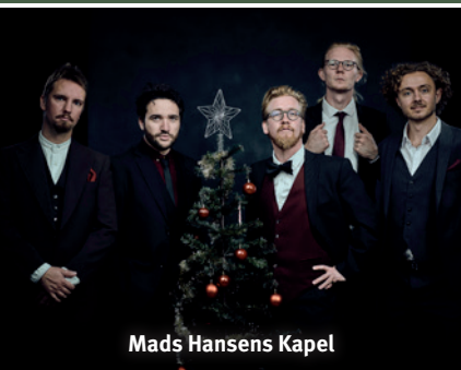
Mads Hansens Kapel