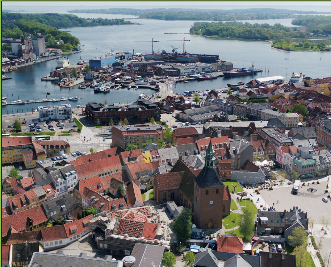
Vor Frue kirke set i fugleperspektiv

Svendborg · August – September – Oktober – November · 2021