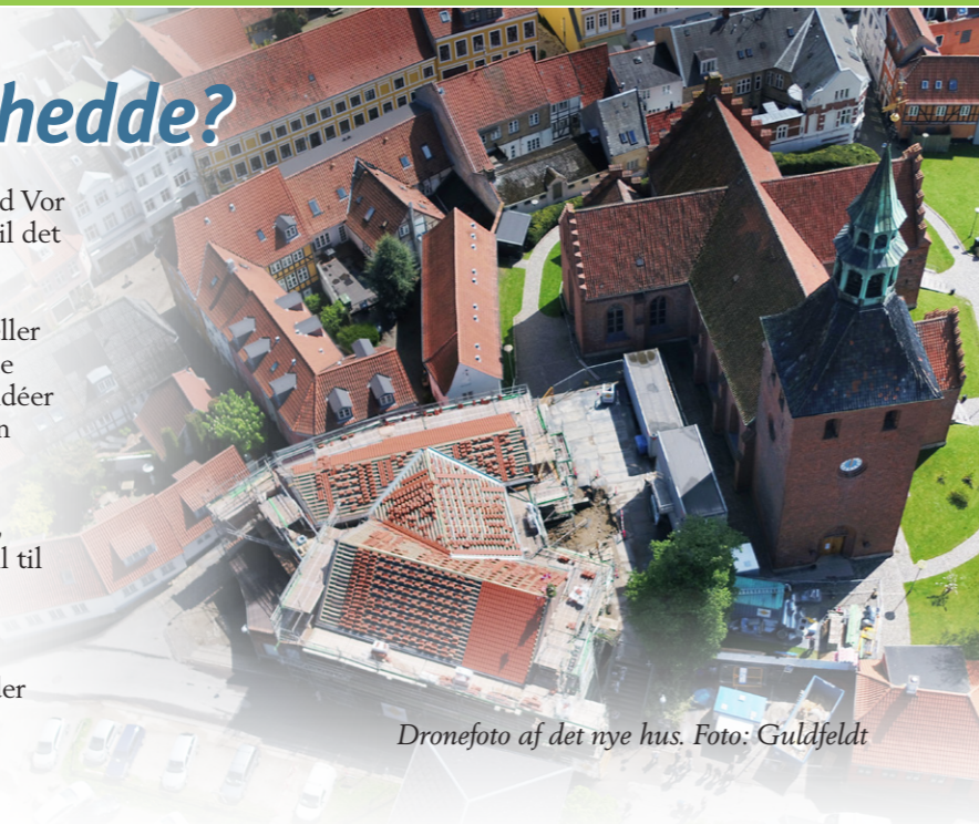
Dronefoto af det nye hus.

Du er velkommen til at indlevere flere forslag og begrund gerne dit/dine forslag. Menighedsrådet forholder sig frit til, om det ønsker at bruge forslaget eller ej.